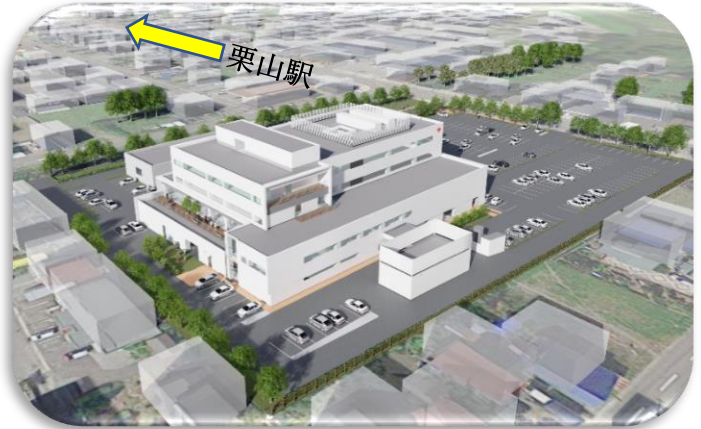
南東方向からの俯瞰イメージ

令和5年10月より工事を開始し、新本館オープンは令和7年9月、現建物の解体等が全て終了してのグランドオープンは、令和8年6月を予定しています。